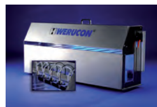
Système de pulvérisation avec caractérisation standard en option

La centrale de lubrification DSS est un système sous pression. Le dispositif de base se compose d'une rampe de fixation avec le nombre désiré de buses de pulvérisation, d'un réservoir de lubrifiant et d'une armoire de commande.