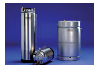
Réservoir lubrifiant 10, 25 et 50 l