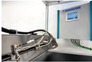
Solution complète WERUCON® DSS avec système de positionnement centrale ZPS et système de commande DSS

Les systèmes personnalisés intègrent des automatisations existantes afin d'optimiser les coûts de lubrifiant, les temps de changement de gamme et augmenter la qualité de surface des pièces.