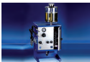
Lubrification MDA avec pompe puissante