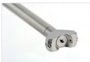
Buse à diffusion large pour déposer sans brouillard