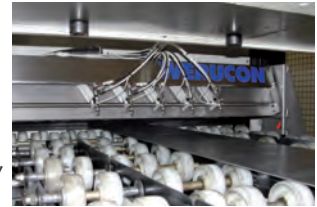
WERUCON® DSS en installation client

Les systèmes WERUCON® de lubrification sans contact sont utilisés dans les domaines de la lubrification de bande, lubrification de flancs, du rivetage et laminage également en entrée de ligne de découpage et emboutissage.